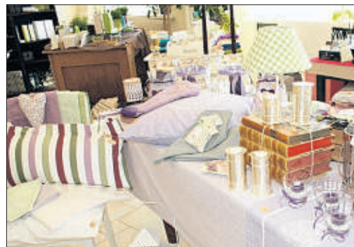
Die Farbe Flieder liegt im Trend - auch im Lille Hus bei der Haus- und Tischwäsche.

In der Fischerklausen (Am See 1, Lütjensee) kann man auch Hochzeit oder Geburtstage feiern, bis zu 70 Personen finden Platz. Geöffnet ist freitags bis mittwochs von 11.30 bis 23 Uhr. Das neue Bootshaus ist wochentags ab 16 Uhr, an den Wochenenden und Feiertagen ab 11 Uhr geöffnet. Am Donnerstag ist Ruhetag. Im Restaurant wird besonders an den Wochenenden eine Reservierung unter ☎ 04154/792200 empfohlen. (bm)