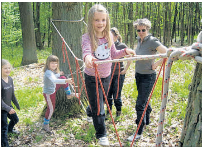
So ein Niederseilgarten ist eine Attraktion für Kinder. Eltern und Pädagogen können lernen, diesen selbst aufzubauen.