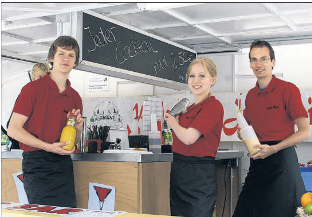
Der Kinder- und Jugendbeirat lockte mit alkoholfreien Cocktails. Leider blieb nicht jeder Jugendliche bei den Drinks ohne Prozente.