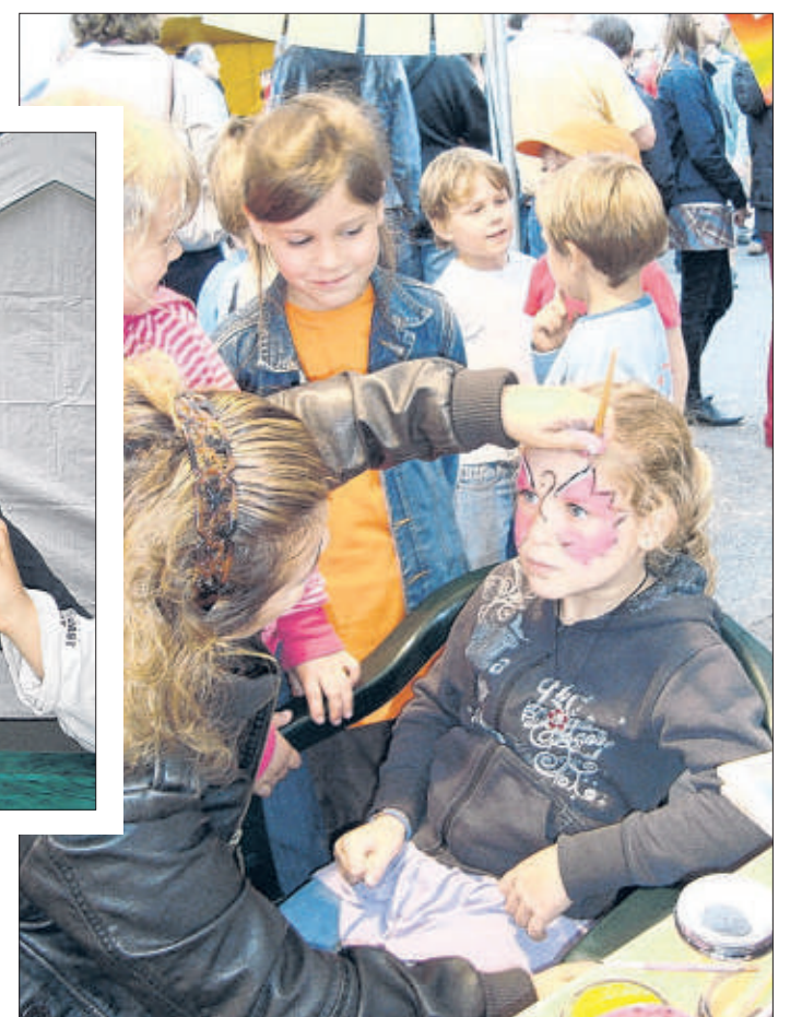
Hüpfburg und Schminken macht Kindern Spaß.

tränke. Veranstalter sind gemeinsam der TSV Lütjensee und die Freiwillige Feuerwehr Lütjensee. (bm)