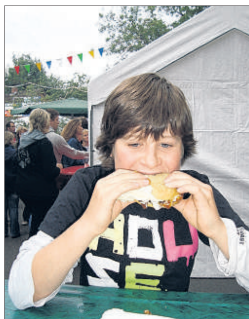
So gut schmeckt ein Lütjenseeburger.

seit Kurzem das Waldstadion bewirtschaften. Zudem gibt es Bratwurst und Ge-