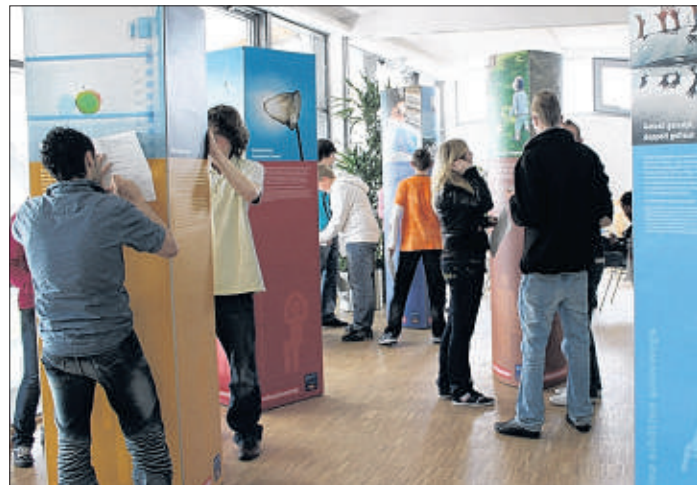
Was der Einzelne tun kann, um dem Klimawandel entgegen zu wirken, erfahren Schüler in einer Wanderausstellung, die für zwei Wochen nach Bad Oldesloe kommt.

BAD OLDESLOE. Vom 29. Juni bis zum 8. Juli ist in der Kreisverwaltung die Ausstellung „Klima schützen kann jeder!“ zu sehen. Zum Besuch der Wanderausstellung der Verbraucherzentrale sind besonders Schüler eingeladen. Verschiedene Themenstationen laden auf unterhaltsame Weise ein, den Treibhausgasen im Verbraucheralltag auf die Spur zu kommen. Wer sich für die Hintergründe der globalen Erwärmung interessiert, findet hier Fakten, Erklärungen und Prognosen. Wie lässt sich der Alltag einfach, lukrativ und klimafreundlich gestalten? Wie kann ich mich klimafreundlich ernähren und gleichzeitig etwas Gutes für meine Gesundheit tun? Welche Möglichkeiten gibt es, sich zu Hause klimafreundlich zu verhalten und wie kann ich mit meinem Mobilitätsverhalten zu einer Entlastung des Klimas und des Geldbeutels beitragen? Fragen, die hier beantwortet werden. Die siebten bis zehnten Stor-